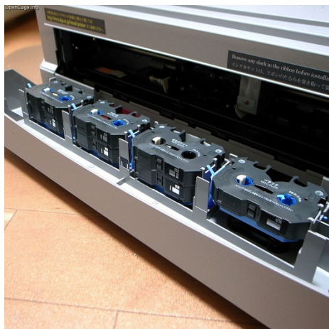
Billedet viser ALPS printeren med åben låge og synlige farvebånd.